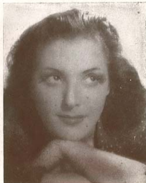
V I C H I D E L G A R D A