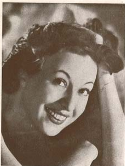
M A R A L A N D I