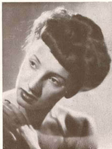
F L O R I A T O R R I G I A N I