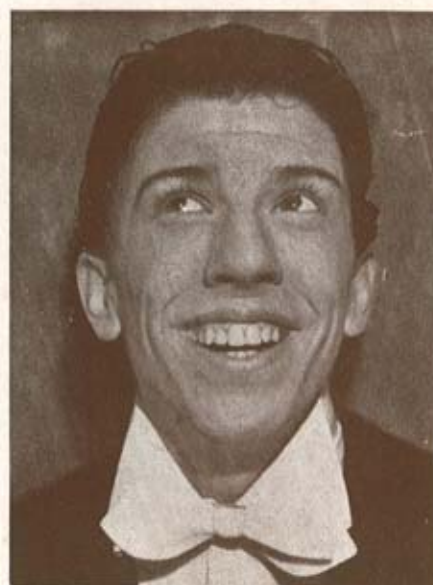
R O G G E R