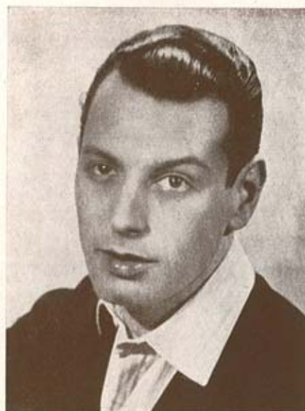
V A L E N T I